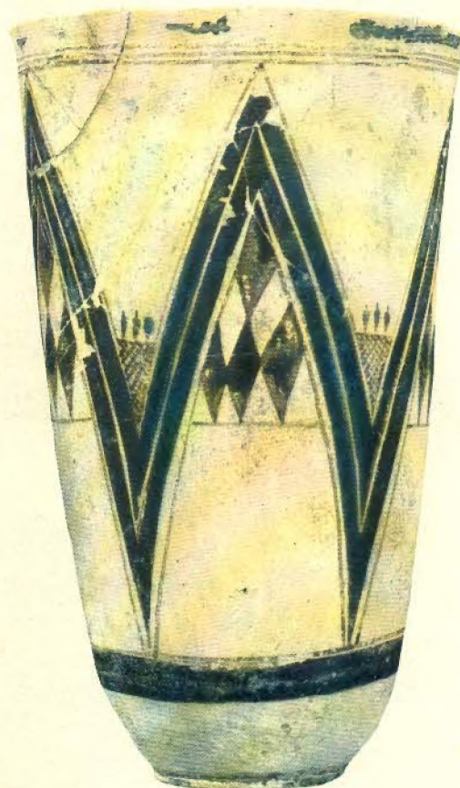
Vaso de cerámica pintada correspondiente a la época más primitiva de Susa, que se remonta probablemente al IV milenio a. de J. C. Las estilizaciones geométricas que lo adornan son símbolos para prevenir conjuros (Museo Real de Arte, Bruselas).

ficiales de que ya hemos hablado, y que además, al hacer capas algo profundas en el suelo, el agua que por ellas se infiltra impide continuar la excavación. Por esto resulta la paradoja de que el país que se ha supuesto ser la cuna de la humanidad no proporciona restos del hombre primitivo; las más antiguas pruebas de la existencia del hombre en Mesopotamia son esos tells de ruinas super-